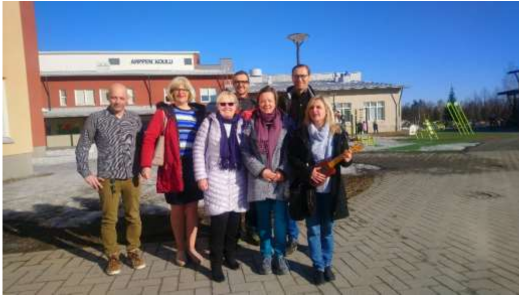
Kitee, 1.-9. ročník